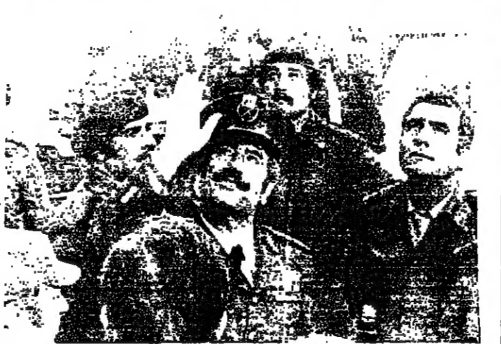
الواء طلاس يبرد الختية لستقبله.

قام اللواء مصطفى طلاس نائب القائد العام للجيش وزير الدفاع السوري بزيارته عدد من كبار القباطين بزيارة قوات الدرع العربية في شمال لبنان امس.